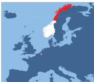
The North Norway European Office

North Norway European Office was established 1 January 2005 and is owned by the three northernmost counties in Norway: Nordland, Troms and Finnmark. The office is located in Brussels and serves as a door opener and arena maker for Northern Norwegian actors in relation to the European Union. The office holds an informational role, with particular focus on the European Arctic policy, regional policy, current industrial policies and Northern European cooperation.