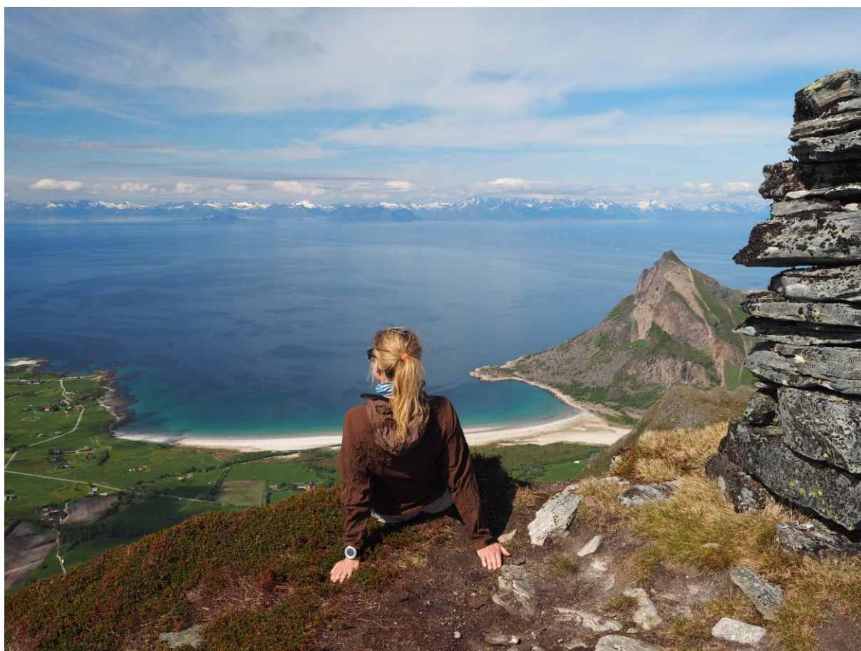
Bøsanden sett fra Trohornet, Steigen.