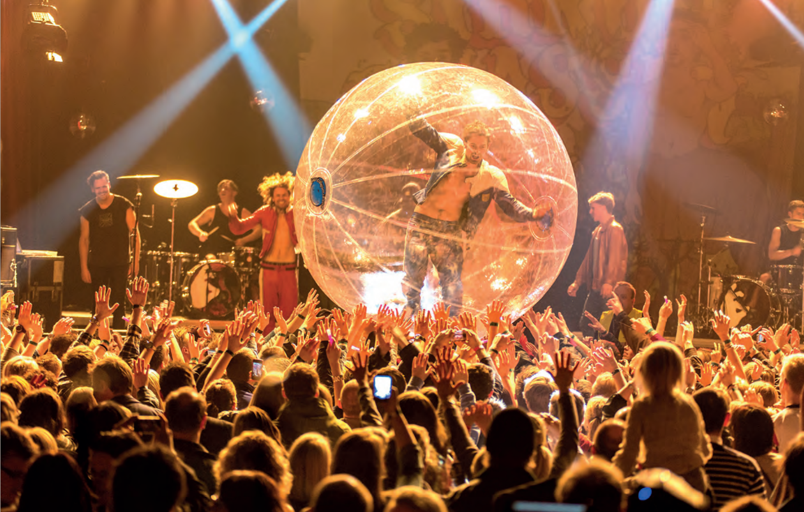
Sirkus Eliassen, Parken 2012