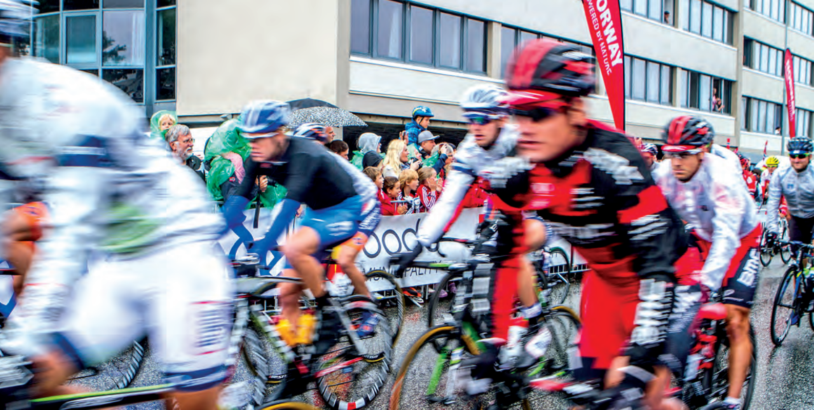
Åpning, Arctic Race of Norway - Bodø 2013 - Foto: Tor E. Akselsen