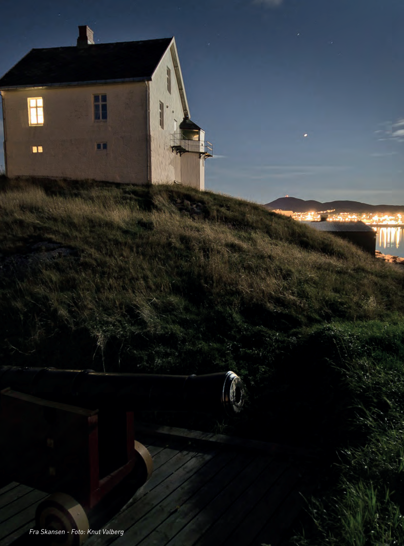
Fra Skansen