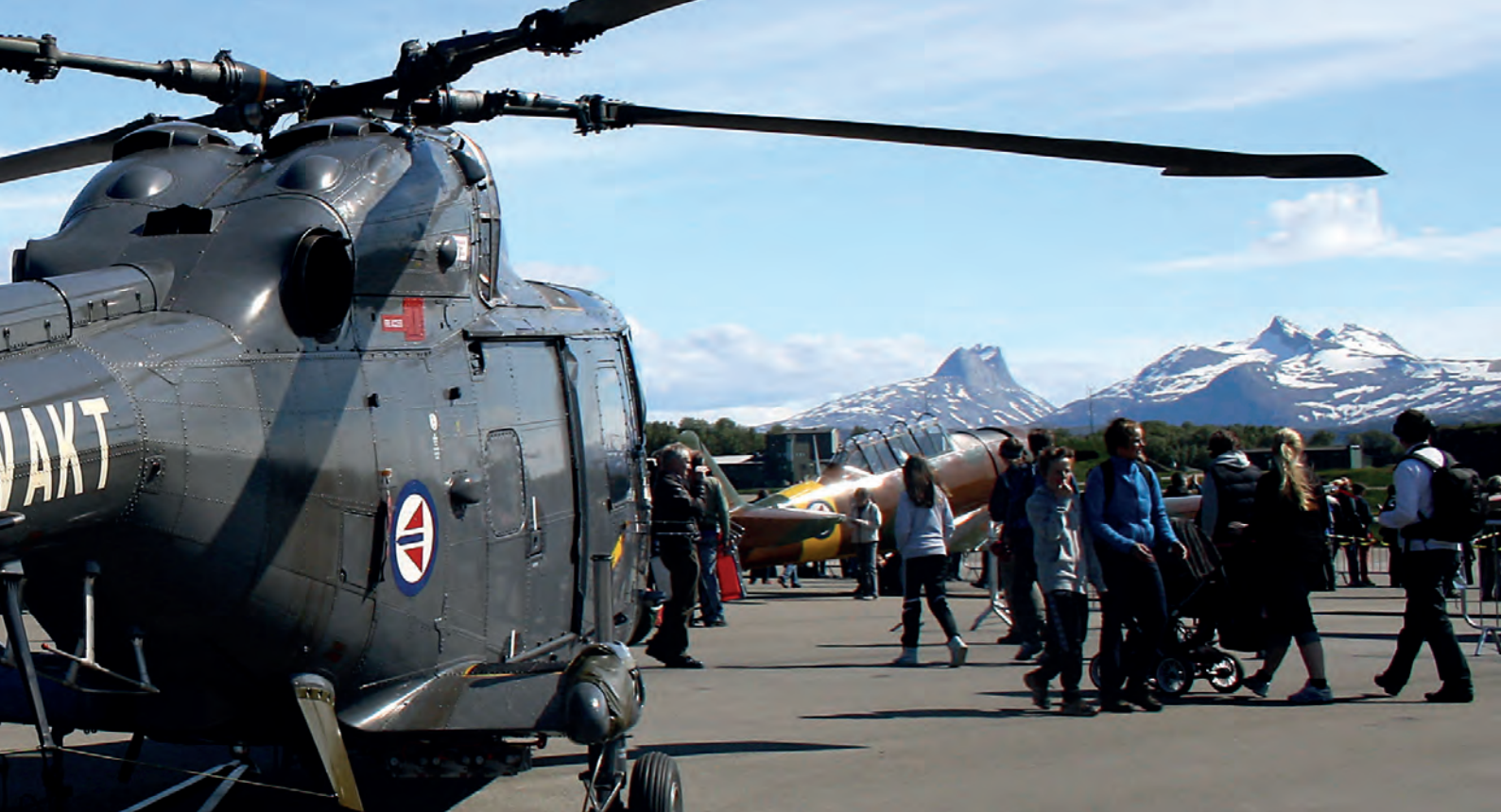
Bodø Air Show 2012 - Foto: Tor E. Akselsen

overordnede operative ansvaret ved søk- og redningsaksjoner fra 65oN og opp til Nordpolen, herunder Svalbard, Barentshavet, Norskehavet og Nord-Norge, og dekker 80 % av Norges sjø- og landareal. Bodø er også vertskap for en av tre kontrollsentraler for luftfart som dekker et tilsvarende areal som HRS.