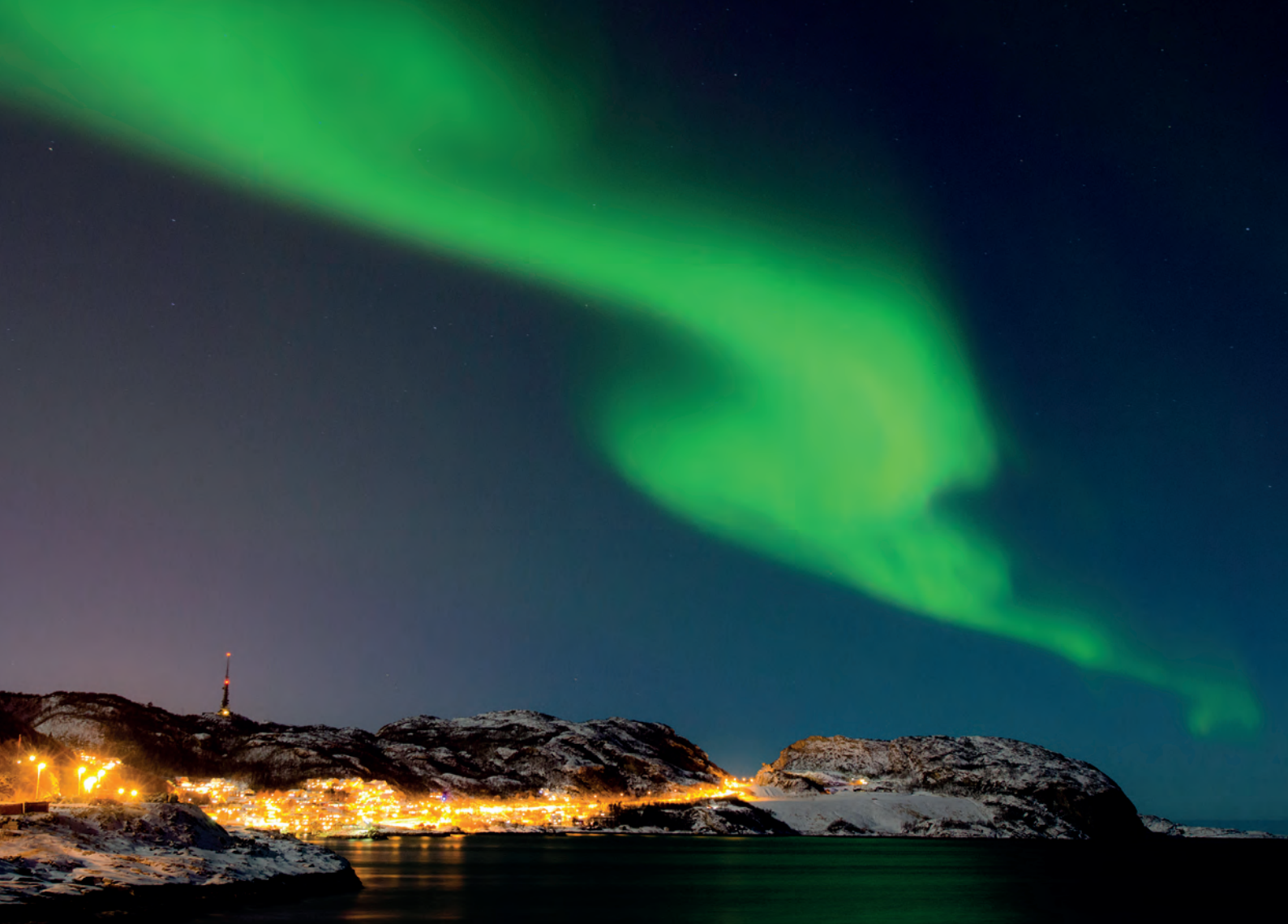
Nordlyset i Bodø