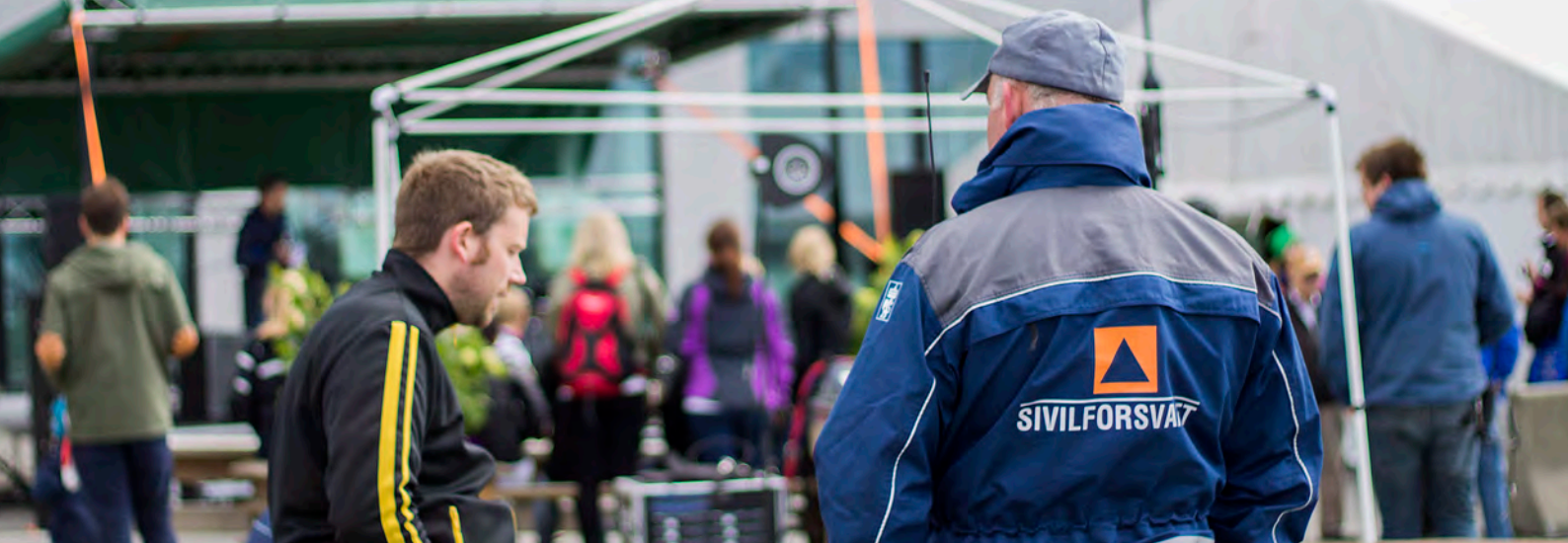
Havnedagan 2013 - Foto: Tor E. Akselsen